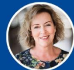
Gyöngyi Pozsgai University of Pécs, Hungary